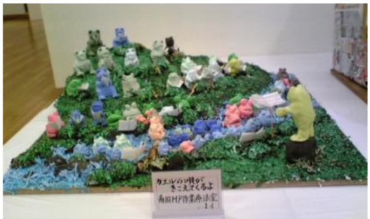
カゴワのかかしコンテスト 高田HP音楽療法室 14