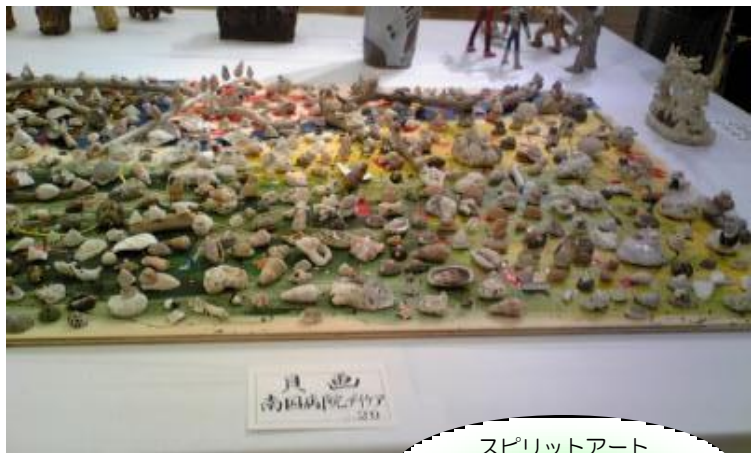
スピリットアート 高知県立美術館 H21.10.9~18